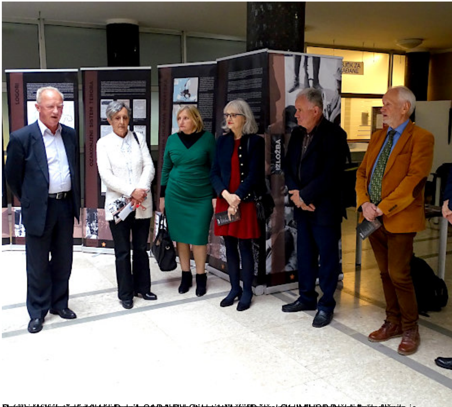
Šest članova županijske uprave u logorima u NDH, u srijedu, 15. svibnja 2019. godine, u muzeju u Zagrebu. Na slici se vidi izložbu "Iza žice" o logorima u NDH.